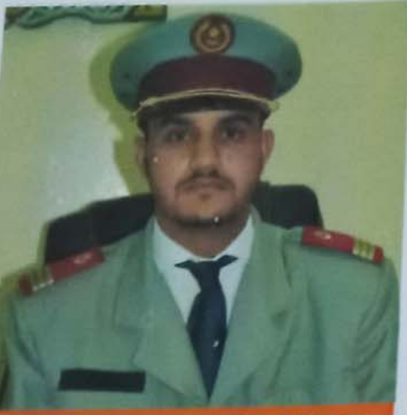
اعداد: النقيب الطبيب محمد يحيى انجيه زين

تسبب التحريات المبداية إلى أن الفيروس قد يتواجد في البراز في بعض الحالات، إلا أن انتشاره عبر هذا المسار لا يشكل سمة رئيسية. وعلى كل