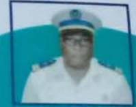
العقيد الشيخ عابدين امبييف