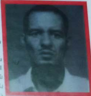
من أبطال الحرس الوطني البارزين سقط على ساحة الشرف شهيدا بتاريخ 15 دجمبر 1975

الاشتباك المسلح ببلدة انال بتاريخ 15 دجمبر 1975 تمتدح الحرب مرارة صادقة تمكس معادن الرجال وصلابتهم وهم يتحركون على شفا حفرة الموت حيث يتحتم على القائد اتخاذ قرارات سريعة ومنتالية وفق تطور المعركة ومسارها المتقلب بين الفينة والأخرى وفي هذا السياق فقد كانت حرب الصحراء ميدانا صادقا مكن رجال الحرس الوطني من إظهار قيمهم وشجاعتهم وإخلاصهم واستماتتهم في الدفاع عن وطنهم وشرفهم. كانت ليلة لا تنسى من ليالي الشتاء داجية لا تتوقف فيها الرياح عن العويل تحمل معها نسمات شديدة البرودة أخذت تتسرب إلى أعضاء أولئك الحرسيين الأشداء الذين صهرتهم ظروف الحرب فهدت واضحة معالمها على قساعات وجباههم المهيبه ونظراتهم المثقلة.