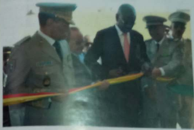
الأجنحة حيث قدمت له شروح فنية حول هذه المنشأة التي أشرفت على إنجازها إدارة الأمن