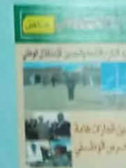
تسليم درون هامة للحرس الوطني