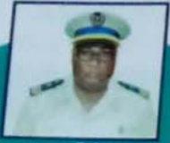
العقيد الشيخ عابدين امعييف