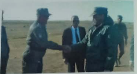
بالإضافة إلى اللواء والضباط الساميين من الحرس الوطني

وصل الفريق مسـ.فارس سيدي أفوري، قائد أركان الحرس الوطني، يوم 27 نوفمبر 2018 إلى مدينة اكجوجت قادما من نواكشوط. وكان في استقباله والي انشيري وحاكم اكجوجت وقائد التجمع الجهوي رقم 12 والسلطات الأمنية في الولاية