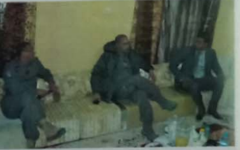
المتواجدين في المدينة بمناسبة الاستقلال.

وفي الختام عقد قائد الأركان بمقر التجمع الجهوي رقم 12، اجتماعا بضباط الحرس الوطني المشرفين على وحدات القطاع المشاركة في المسير العسكري، واستمع القائد لشروح وتدخلات من طرف الضباط حول