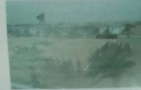
الطلبة الضباط العاملين