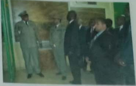
المرافق له تمارين نموذجية تحاكي طريقة عملها أبايت فيها عن قدرتها الكبيرة وجاهزيتها المطلقة للتدخل عند الحاجة.