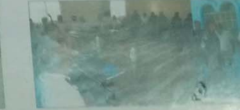
تجمع الأمن الخاص رقم 4