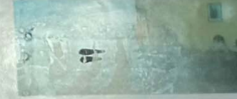
تجمع الأمن الخاص رقم 2