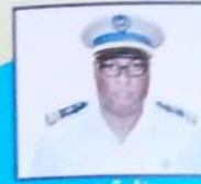
العقيد الشيخ عابدين امريف