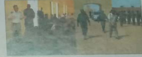
تجمع الأمن الخاص رقم 1

وفي كلمته بالمناسبة، قال قائد الأركان ان الهدف من زيارته لتشكيلات هو الاتصال المباشر بالأفراد لمعرفة مشاكلهم ومعينة ظروف عملهم ودعا الأفراد الى المحافظة على الصورة الناصعة للحرس الوطني التي تركتها اجياله السابقة والتسك بتقليده العريقة وقيمة العسكرية النبيلة. كما حث اطر التشكيلات على الالتزام بالمسؤولية وروح المهنية خلال ممارستهم للمهام القيادية عبر