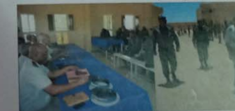
التجمع القيادة والخدمات

قام الفريق مسبقا سيدي اقويزي، قائد اركان الحرس الوطني، في الفترة ما بين 25 ابريل - 9 مايو 2019، بزيارات لتشكيلات الحرس الوطني في نواكشوط للاطلاع على ظروف العمل والحوال الأفراد وتضمن برنامج الزيارات ما يلي: