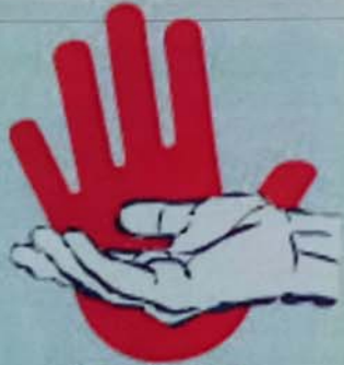
كافح التسول وماعد من يستحق Combat Begging & help Indigents

مع التطور الاجتماعي - الاقتصادي - العمراني الهائل الذي شهدته بلدنا في العقود الماضية، انتشرت ظاهرة التسول في المدن وخاصة نواكشوط العاصمة، واصبحت هذه الظاهرة المقيتة تمارس بشكل واسع في الشوارع والأزقة وفي المراكز والإدارات العمومية من طرف مجموعة كبيرة ومتنوعة من الأشخاص. وليس بالضرورة أن يكون المتسول معدوماً، فبعضهم قد