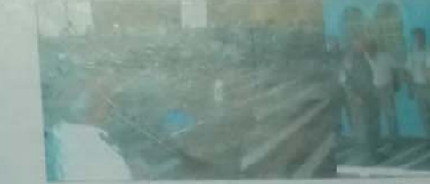
تجمع الأمن الخاص رقم 3