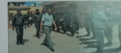
التجمع الجهوي رقم 9