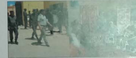
تجمع الجهوي رقم 10