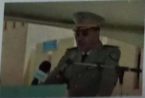
تسليماً في مجال التكوين والتأهيل والتنظيم والبنية التحتية والتجهيزات وتحسين الظروف المعيشية للأفراد.

خط الحرس الوطني، حيث أطلق على المشرفون التاريخي سرية المسيرة. وفي الختام، شكر الوزير والوفد المرافق له على حسن الاستقبال والتعاون الذي أبداه جميع المسؤولين في الدولة الموريتانية، مؤكداً على أهمية