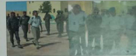
تجمع حفظ النظام والقتال رقم 1

وكان قائد الأركان مصحوبا خلال هذه الزيارات بوفد هام من قيادة الأركان ضم العديد من المديرين ورؤساء المكاتب. ونشير الى أنه قد ناب عن قائد الأركان في زيارته لتجمع القيادة والخدمات اللواء محمد ولد باب احمد قائد اركان الحرس الوطني المساعد.