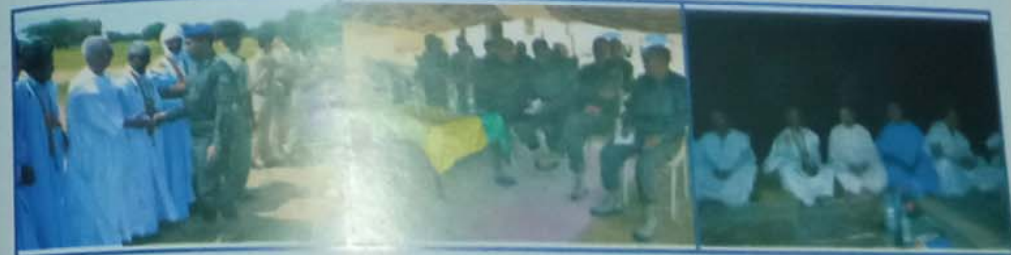
بعين العصور من زيارة لتجمع الجهوي رقم 1