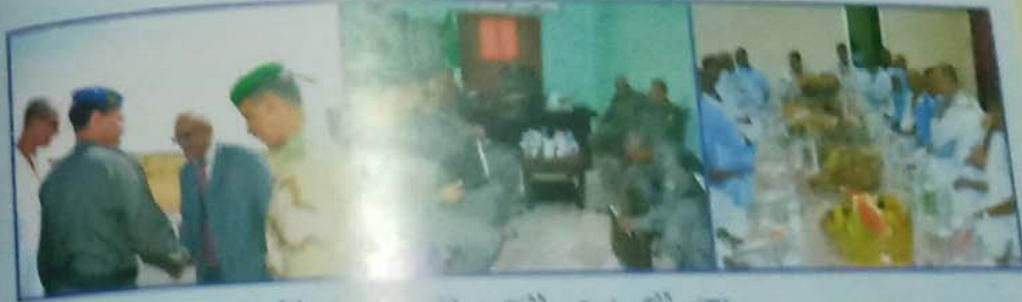
بعض الصور من التجمع الجهوي رقم 11