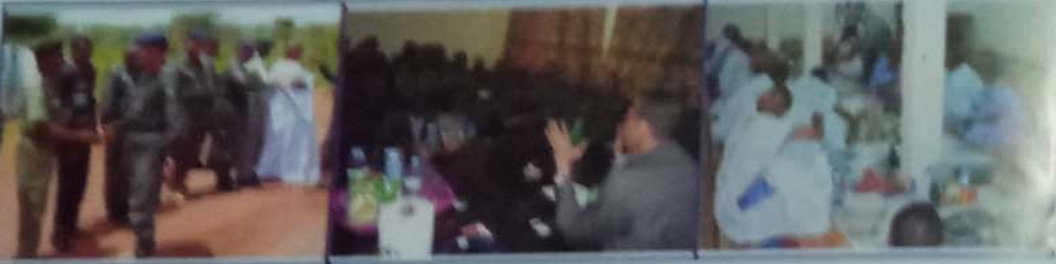
بعض الصور من تجمع سرايا حلف التقدم والقتال رقم 2