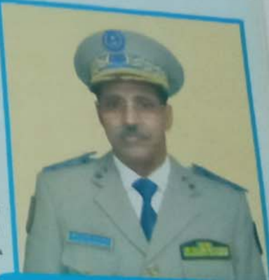
بعين العصور من تجمع سمط (القطاع) والقطاع رقم 2

قام اللواء مسقار ولد سيدي، قائد أركان الحرس الوطني، في الفترة ما بين 31 اغشت الى 02 سبتمبر 2016، بزيارة للتجمعين الجهويين رقم 2 (الحوض الغربي)، ورقم 1 (الحوض الشرقي) وتجمع الجمالة. وقد شكلت هذه الزيارة آخر محطة من زيارات قائد الأركان الميدانية للتشكيلات الحرس الوطني بالداخل، وتضمنت الزيارة اجتماعات بقيادة التشكيلات المذكورة وقادة الوحدات الترابية. وقد مكنت الزيارة قائد الأركان من التعرف على مشاكل وواقع هذه التشكيلات. وقد حضر القائد في اجتماعه مع الأطر والأفراد على التفاني في الخدمة والتحلي بالقيم العسكرية الفاضلة. كما أكد على ضرورة صيانة المعدات والبنى التحتية. وقد قام قائد الأركان بهذه الزيارة رفقة وفد من قيادة الأركان ضم العديد من المديرين وروساء المكاتب.