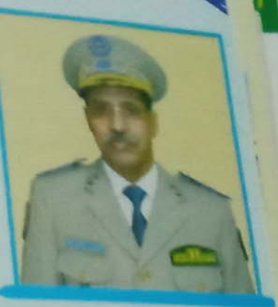
بعض الصور من التجمع الجهوي رقم 04

قدم اللواء مسفر ولد سيدي، قائد أركان الحرس الوطني، في الفترة ما بين 11 إلى 14 أگشت 2016، بزيارة للتجمعات الجهوية رقم 4 (أبو ليراكته)، ورقم 11 (في خور شول) ورقم 10 (في كيديما تاه). وأختمت الزيارة اجتماعات بقيادة التجمعات المذكورة وزيارات ميدانية للوحدات القرعية. وقد مكثت الزيارة قائد الأركان من التعرف على مشكلات وواقع هذه التشكيلات. حضر قائد الأركان خلال اجتماعه مع الأطر والأفراد، على التقاسي في الخدمة والتعالي بالقيم العسكرية الفاضلة وعلى القيام بالمهام بكل مهنية كما أكد على ضرورة صيانة المعدات والبني التحتية. وكان قائد الأركان مصحوبا خلال هذه الزيارة بوفد من قيادة الأركان ضم العديد من المديرين ورؤساء المكاتب.