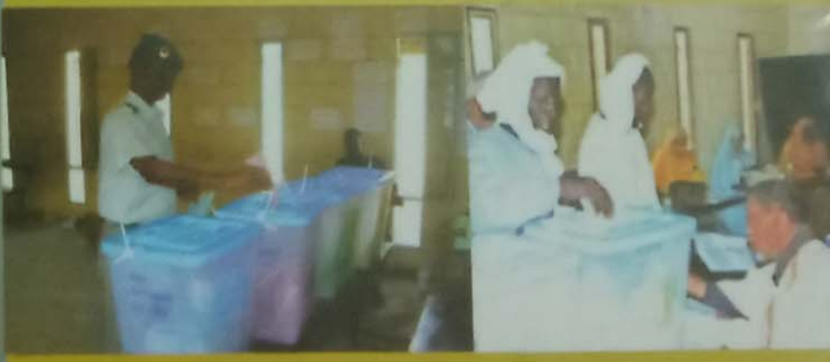
لانتخابات التشريعية و البلدية 2013