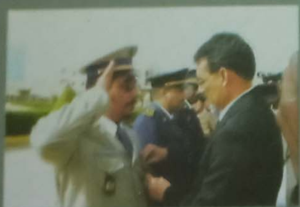
وزير الداخلية و الامركزية يوضح عددا من افراد قطاعه