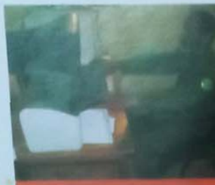
الرفيق أول الحاج ولد الطيب رئيس القطاع الترابية