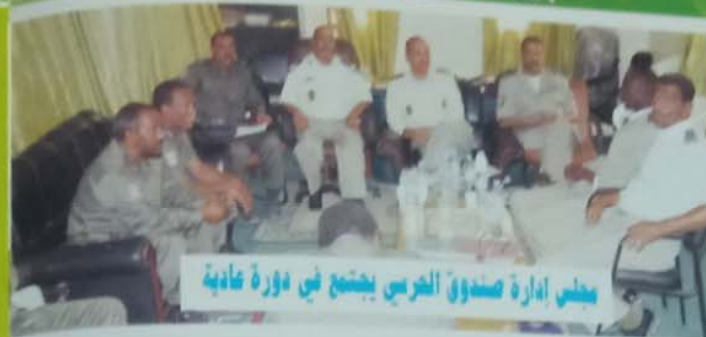
مجلس إدارة صندوق الحرس يفتح في دورة عادية