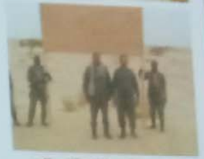
الالة مصرية في المكان الذي سيقام فيه بناء قصر الحرس الوطني بالمقاطعة أشرف رئيس الجمهورية السيد محمد ولد عبد العزيز يوم 28/06/2010 في الحوض الشرقي على وضع حجر الأساس لإنبيكت نحواش عاصمة مقاطعة اظھر.

وأضاف رئيس الجمهورية أن الحكومة اتخذت القرار ببناء هذه المقاطعة التي ستتوفر على جميع المنشآت الحيوية الضرورية في مجالات المياه والتعليم والصحة، وستستفيد من مشروع لإدخال الكهرباء في هذه المنطقة وستكون جميع الإدارات فيه، وقال رئيس الجمهورية إن سكان المقاطعة هم من سيرفع من شأنها مطالباً بالتصاميم بين جميع السكان وبنيد التفرقة. وطالبت رئيس الجمهورية سكان المقاطعة بالتوجه التي مركز الحياطة المدنية للحصول على أوراقهم المدنية لأن ذلك هو ما سيمكنهم من الاستفادة من هذه الخدمات التي ستتوفر في هذه المقاطعة. وتوجه رئيس الجمهورية إلى حفل وضع الحجر الأساس وزير الأشغال العمومية والبنية التحتية وأوضح أهمية هذه المقاطعة في التنمية الاقتصادية والاجتماعية للمغرب، مؤكداً على أن هذه المقاطعة ستوفر الخدمات الضرورية للسكان في هذه الحوزة من خلال الذي اكتتمه الإهمال لسكان لفترة طويلة من الزمن.