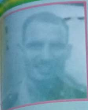
الوطنى لعهد الاستقلال الوطني

ولد المصور له المساعد أول لمعات ولد انديه عام 1932 بطنجة، ثم اكتتبه في قطاع المصورين الوطني بتاريخ 1961/04/15، وحصل على الترفيق التالية: رتبة حرس مزجة ثلثة بتاريخ 1963/10/15 رتبة حرس مزجة ثلثة بتاريخ 1965/10/15 رتبة قائد بتاريخ 1967/04/1 رتبة قائد أول بتاريخ 1969/11/01 رتبة مساعد بتاريخ 1971/11/01 رتبة مساعد أول بتاريخ 1976/01/01 عُيِّن في عام 1976، مُجمَّع جوية قبل أن يعضد شبيداً على سائمة الشرف وهو يودي وأخيه الوطني خلال أحداث حرب الصحراء بتاريخ 1976/04/24، بعد 19 سنة من الخدمة تحت العلم الوطني بروح الإخلاص والتضامن للشعبه. عر من رحمه الله بالقيام بالمرامة والترميم، وعرضه على إطلاق اسمه على الحي السكني بحرس الوطني بمقاطعة جوفات الذي يشه معالي وزير الداخلية والامركزية بتاريخ 2009/11/26، في إطار التظاهرات المتعددة للذكرى التاسعة والأربعين لعهد الاستقلال الوطني.