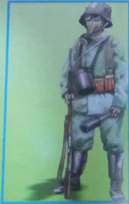
UN FANTASSIN ALLEMAND EN 1916

La résistance des combattants français à Verdun est relatée dans le monde entier. La petite ville meusienne, acquiert une réputation mondiale. Cette victoire défensive est considérée par les combattants comme la victoire de toute l'armée française. Pour la nation française tout entière, Verdun devient le symbole du courage et de l'abnégation.