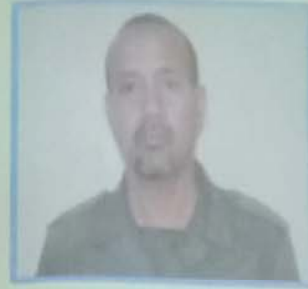
إمهله الخطيب: الصين ولد الفهد

حكم : - لا تصجر من الخطأ حين الوقوع فيه ولكن عالج الخطأ بالرجوع إلى الصواب . - كرر " لا حول ولا قوة إلا بالله " فإنها تشرح البال وتصلح الحال وتحمل الانتقال وترضي ذا الجلال . - إياك والذنوب فإنها مصدر الهموم والأحزان وهي سبب التكببات وبياب المعائب والأزمات . - إذا أقدرك الله على من ظلمك فاجعل العضو عنه شكرا لله . - كن رجلا يسأل رجل فإن لم تستطع فكن رجلا ولا تكن نصف رجل .