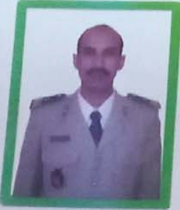
إسمه الفيلسوف المحبوب ولد عثمان