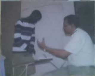
صور المترشحين وهم يقدمون ملفاتهم وإثناء المسابقة