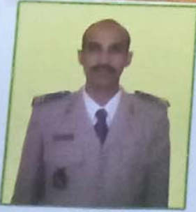
إعداد الكاتب: محبوب ولد مطنان