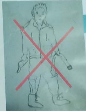
محافظتك علي مظهرك « مصالحتك مع ذاتك »

قال بعض الحكماء الناس ثلاث طبقات تسوسهم ثلاث سياسات: طبقة من خامة الأحرار تسوسهم بالعطف و اللين و الإصان و طبقة من خامة الأشرار تسوسهم بالغلظة و العنف و الشدة و طبقة من العامة تسوسهم باللين و الشدة نثلاً لترجمهم الشدة و لا يطرهم اللين.