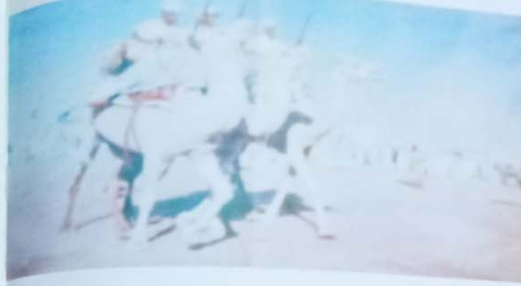
حرس الدوائر في مسيرة عسكري

لقد تحدثنا في الأعداد السابقة عن نشأة الحرس الوطني من خلال تداخله مع قدوم فرنسا إلى غرب أفريقيا كقوة استعمارية وكذلك من خلال تشابك نشأته مع قيام الدولة الموريتانية الحديثة، وفي المقالة التالية نتناول التسلسل التاريخي لتشكله كقوة عسكرية نظامية.