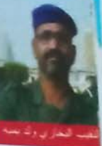
مفتي العراق الشيخ محمد صالح المنجد