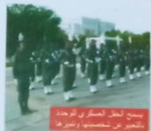
يسبح لعل العسكري للوحدة بالعلم عن شخصيات وغيرها

عريض الطول، وهو عبارة عن قطعة القماش الملونة التي تحمله الجوقة الموسيقية وقائد الاستعراض.