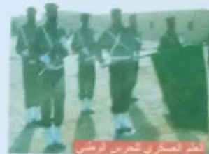
علم عسكري للحرس الوطني

منذ نشأة الشعوب ظل العلم يشكل علامة الانتماء ونقطة