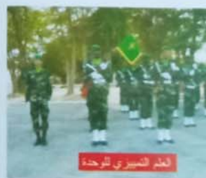
علم عسكري للوحدة

وعندنا في موريتانيا، يحمل الوجه الأول من العلم العسكري: الجمهورية الإسلامية الموريتانية مكتوبا تحتها اسم القطاع العسكري المعنى: (الجيش الوطني، الحرس الوطني، الدرك الوطني... الخ)، أما الوجه الثاني فيحمل شعار