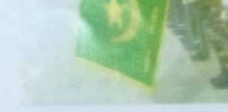
علم عسكري للحرس الوطني

ويتكون العرض العسكري من وحدات الاستعراض ومجموعة